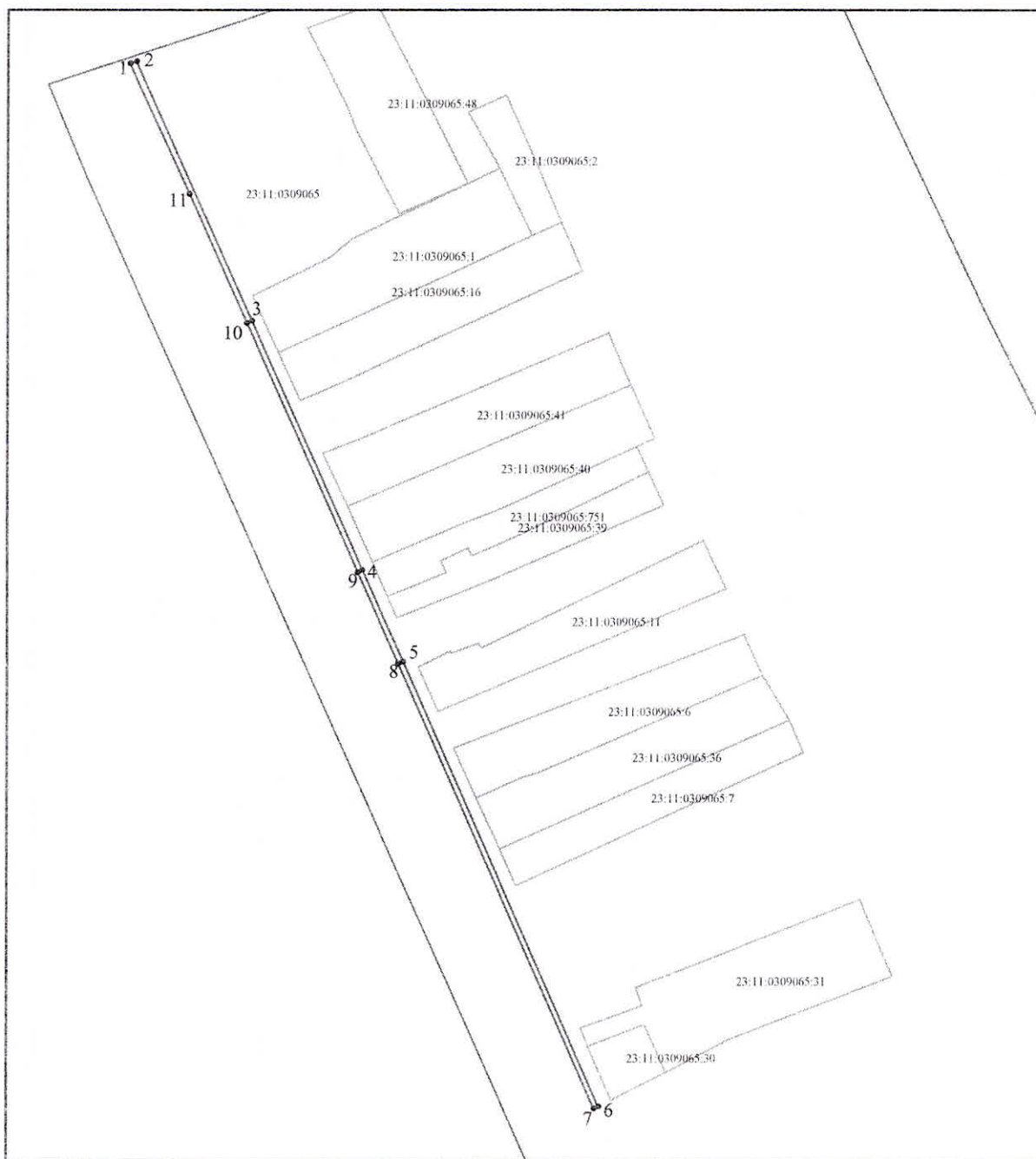
СХЕМА расположения земельного участка на кадастровом плане территории