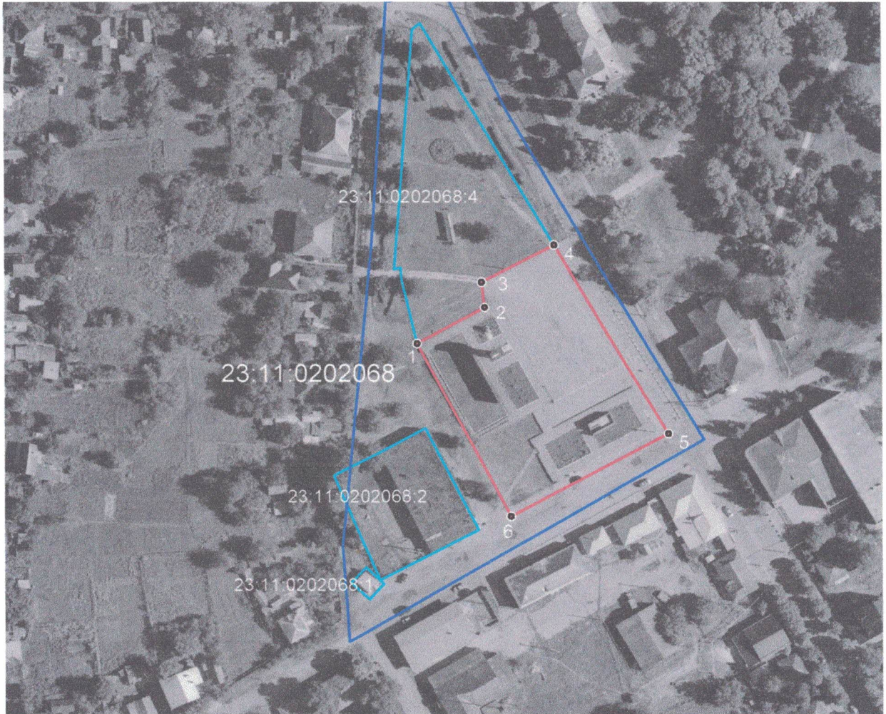
СХЕМА расположения земельного участка на кадастровом плане территории