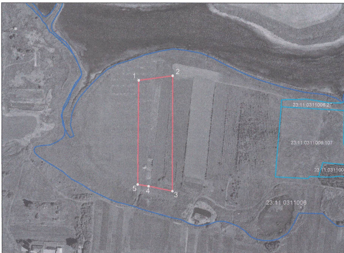
СХЕМА расположения земельного участка на кадастровом плане территории