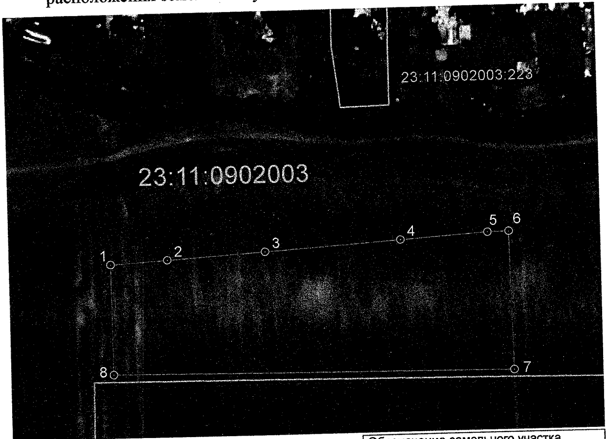
СХЕМА расположения земельного участка на кадастровом плане территории

Масштаб 1:2000 Система координат - МСК 23, зона 1