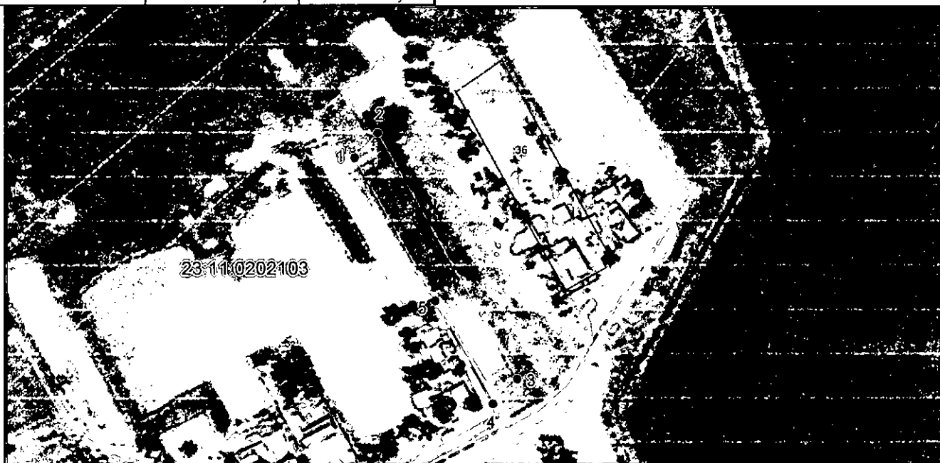
Система координат: МСК-23, зона 1 Масштаб 1:2500