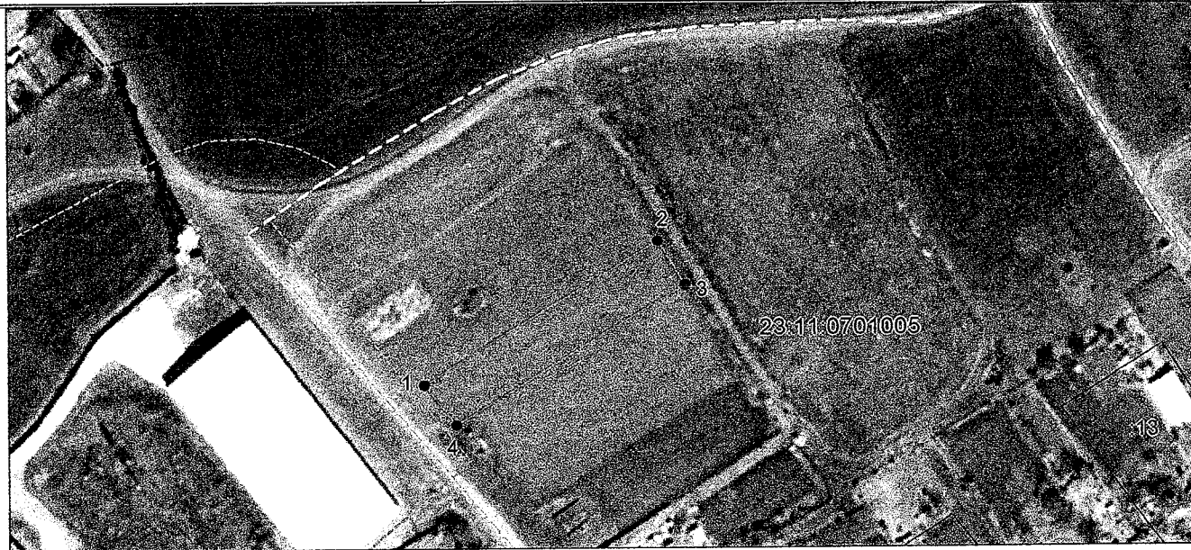
Система координат: МСК-23, зона 1 Масштаб 1:2000