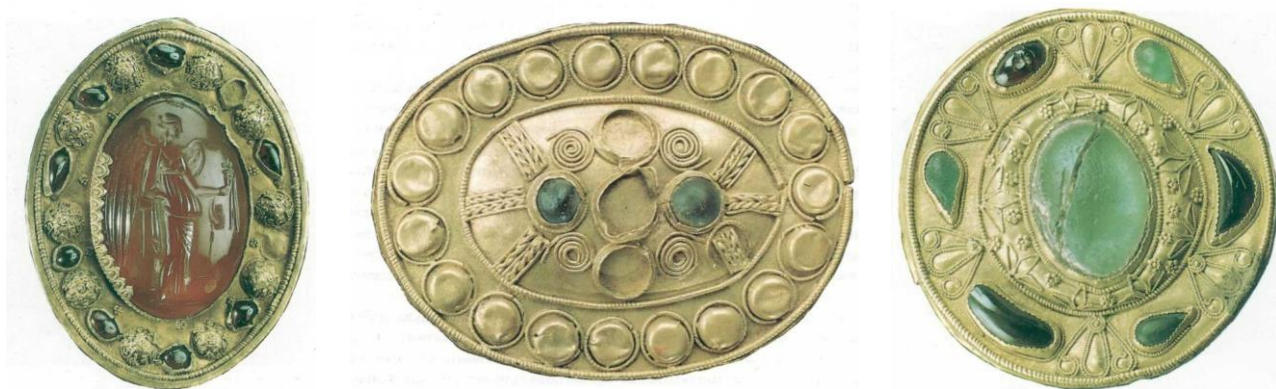
Фибулы-броши. II век до нашей эры

Зеркала делались из бронзы, с хорошо отшлифованной лицевой стороной. На обороте обычно был нанесён рельефный орнамент, но на артефактах, привезённых торговцами по Великому шёлковому пути, встречаются и китайские иероглифы. Зеркала большей частью были небольших размеров и иногда носились в кожаных футлярах.