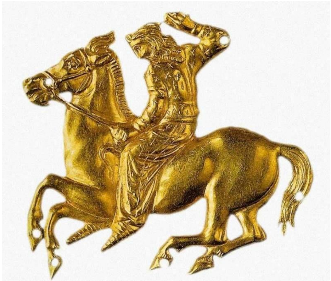
Золотая нашивка с изображением скифского воина. IV век до нашей эры

Скифы приняли их за молодых мужчин и вступили с ними в схватку. После битвы, рассмотрев погибших, они поняли, что это женщины.