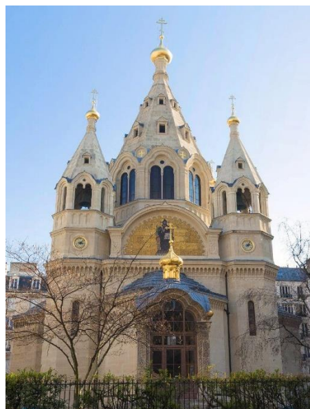
Кафедральный собор на рю Дарю в Париже