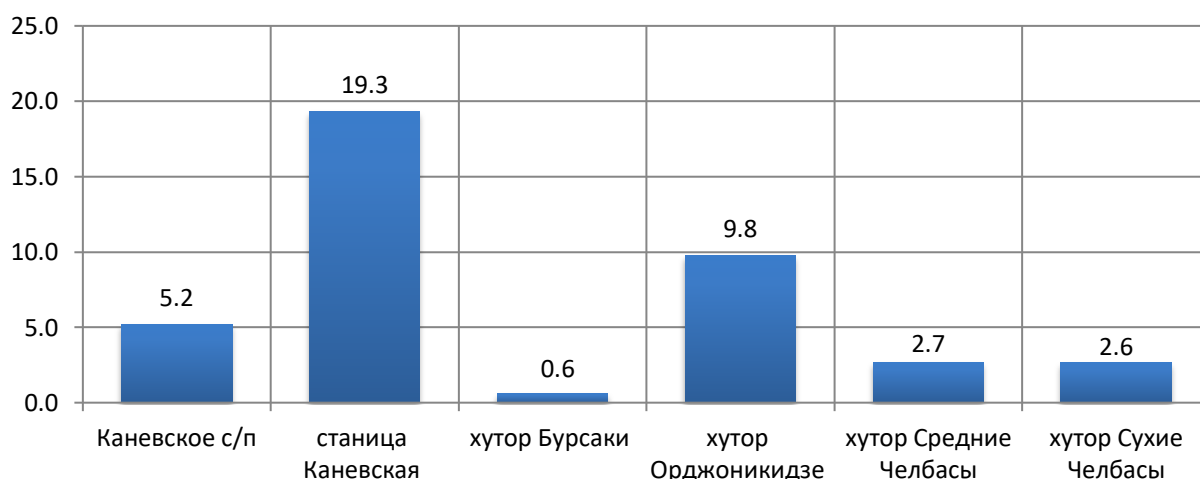
Плотность населенных пунктов входящих в состав Каневского сельского поселения по состоянию на 01.01.2015 г. (средняя 6,7 чел/га)

Динамика численности населения характеризуется его увеличением с 1989 по 1998 гг. в связи с резким повышением миграционного притока из стран бывшего СССР, достигшего своего пика в 1994 году. Данный период обусловлен снижением естественного прироста населения, а в последствии и появлением естественной убыли населения, связанной с экономическим кризисом в стране, который стал причиной снижения рождаемости и продолжительности жизни. Несмотря на приведенные негативные факторы демографической ситуации, миграционное движение в этот период высоко, оно не только восполняло